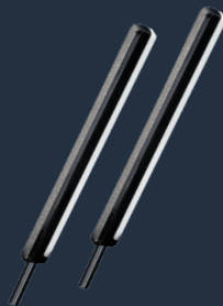
9990 max et Set di aste in ceramica e diamantate