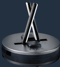
9990 max Affilacoltelli